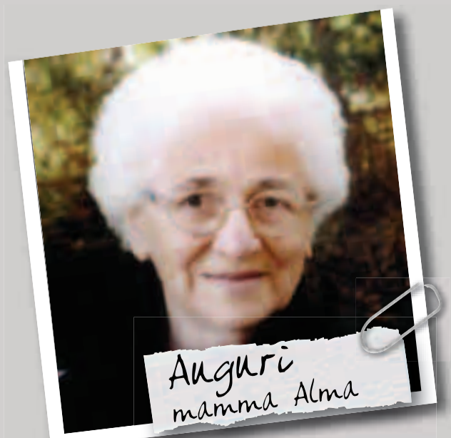
Oggi per la nostra cara mamma è un giorno davvero speciale. Tantissimi Auguri per i tuoi 90 anni con affetto e riconoscenza dai figli, nipoti e vidazza.

Best wishes... Auguri a... Wünsch... Voeux à... Best wishes... Auguri a... Wünsch... Voeux