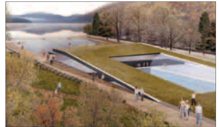
La piscina all'ex Cus con zoo acquario sulla darsena

Pergine | Installati nelle piazze Gavazzi e Serra sembrano degli smartphone