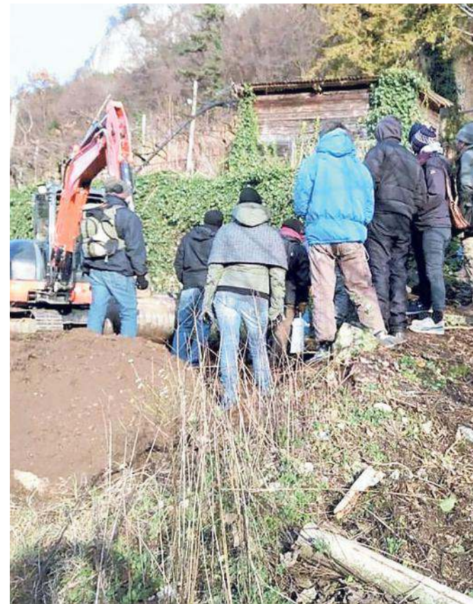
Una protesta contro i lavori previsti per il vallo-tomo

Provincia la richiesta di verifica da parte di «primario istituto universitario» (che si sarebbe poi rivelato il Politecnico di Torino) delle ipotesi di intervento presentate da protezione civile e comitato "daVicoloaVicolo". La Provincia ha quindi incaricato il professore, di riconosciuta competenza e professionalità, della redazione in tempi brevi di una perizia tecnica, considerandola una valutazione indipendente sulla situazione di fatto e sulla documentazione progettuale, ri-