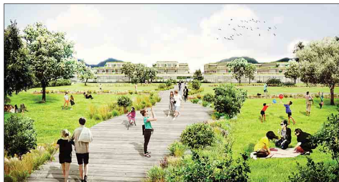
La vista di parte dell'area dalla prospettiva sud, dal lago verso viale Rovereto

La nuova proposta di riordino e valorizzazione di un'area pregiata come il compendio nord dell'ex Cattoi non arriva in un momento qualunque. Tra poco più di una settimana il consiglio comunale dovrà discutere del diniego all'istanza presentata dalla proprietà nel febbraio scorso (un mese prima della scadenza del piano fasciata) e la «mossa» della cordata trentino-altoatesina evidenzia ancora una volta la grande attenzione e la dimisticchezza degli imprenditori interessati con la strategia comunicativa, oltre alla volontà di avviare un vero confronto sulle cose da fare, sui contenuti, sui progetti, con l'interlocutore pubblico e con la città. Da gennaio ad oggi sono state dedicate pagine e pagine sul futuro dell'area Cattoi nord e in questi mesi la stessa proprietà ha confezionato una nutrita rassegna stampa che mette prima di tutto in risalto le voci favorevoli all'intervento privato e alla richiesta di un confronto positivo con l'amministrazione