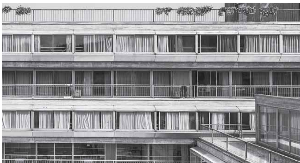
Le immagini in bianco e nero valorizzano l'aspetto "decadente" di alcuni particolari