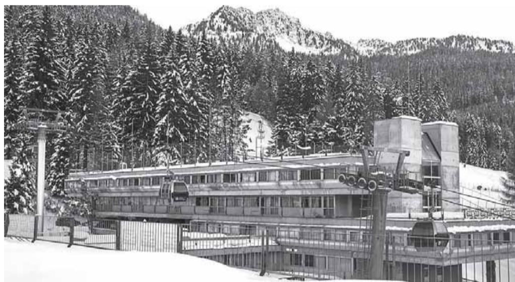
Qui sopra e a destra due immagini del corpo principale degli edifici di Marilleva

Gli scatti di Luca Chisté per una delle strutture più discusse del Trentino. L'indagine rievoca la visione urbanistica del celebre Piano di Samonà