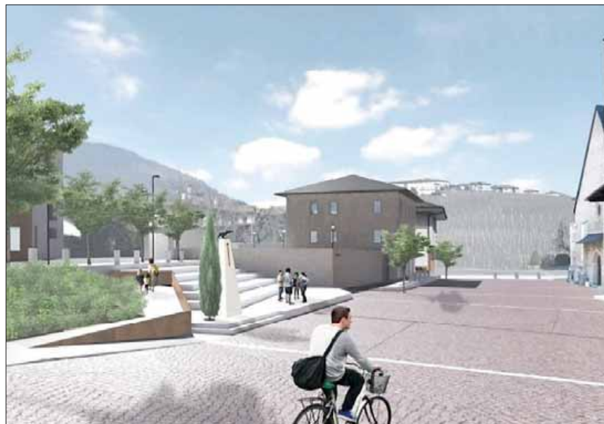
Il rendering e la planimetria della piazza di Tassullo come riprogettata da Stefano Endrizzi

L'opera è suddivisa in due lotti (rispettivamente da 720 mila e 338 mila euro complessivi): per il primo, da appaltare entro fine anno, è già stato ottenuto un finanziamento statale di 337 mila euro, per il secondo si punta ai fondi del Pnrr. Nei confronti del preliminare il