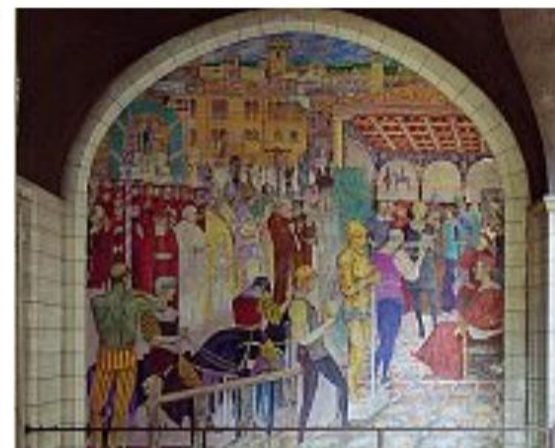
Opere di Palazzo Roccabruna, dipinti sulla facciata di Palazzo Geremia a Trento, sotto Palazzo delle Poste

per i beni culturali della Provincia autonoma di Trento, il libro vede anche la collaborazione del Dipartimento di Lettere e Filosofia dell'Università di Trento. Una pubblicazione resa possibile grazie al contributo economico di vari soggetti pubblici e privati, ma che ha già avuto grande riscontro nella prevendita, a conferma del carattere collettivo.