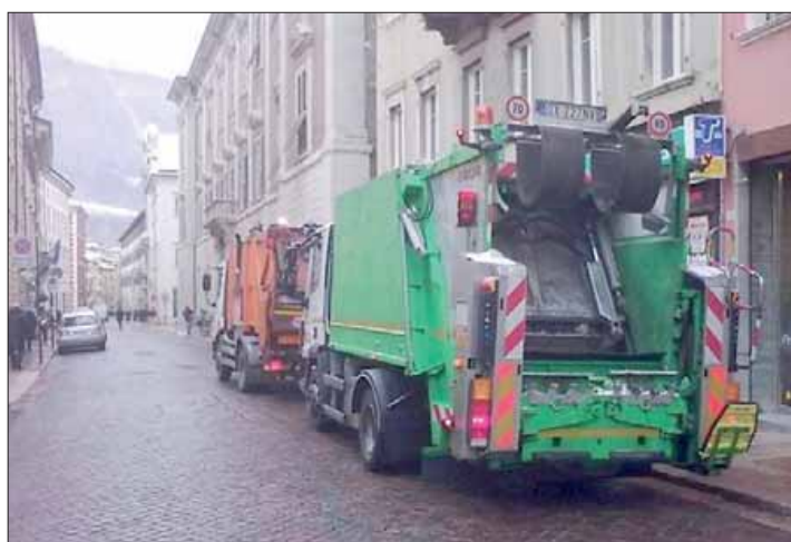
Un mezzo per la raccolta rifiuti in città