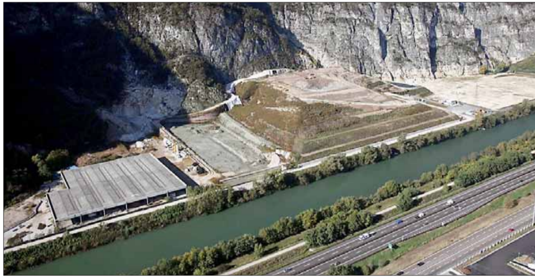
La discarica di Ischia Podetti, l'unica attiva in Trentino, è la candidata numero uno a ospitare l'impianto di smaltimento