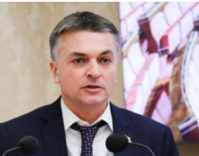
Ministro Edoardo Rixi, vice del ministro delle Infrastrutture e dei Trasporti Matteo Salvini

«Il documento di fattibilità delle alternative progettuali è concluso. Rfi ha svolto le attività previste nel 2021 dal Protocollo d'Intesa con la Provincia autonoma di Trento e ne ha trasmesso nel 2022 gli esiti positivi. A seguito delle valutazioni del Mit, in base a quanto previsto, potremo prevederne l'inserimento nel primo aggiornamento utile del Contratto di programma. Conseguentemente, potremo stabilire il fabbisogno finanziario per le successive fasi di progettazione e realizzazione. Abbiamo tutto l'interesse, tutte le intenzioni di mantenere fede agli impegni e alla tabella di marcia».